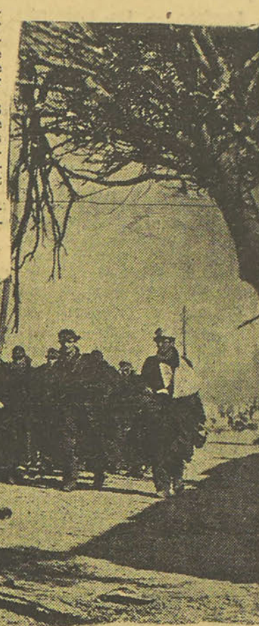
L'entrée des Britanniques à Bardia

Dans le secteur de Halfaya, en dépit des tempêtes de sable continues, nos forces aériennes ont attaqué avec persistance et avec succès les positions ennemies durant toute la journée.