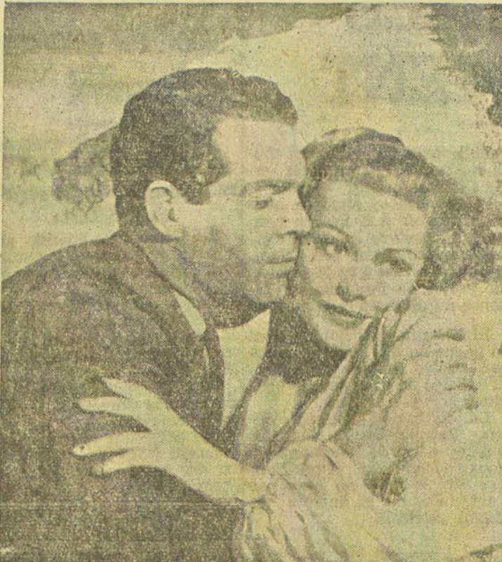
Madeleine Carroll et Fred MacMurray sont les vedettes de ce nouveau film.