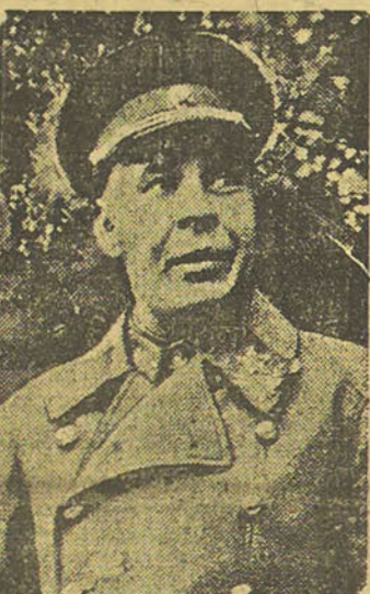
Face à face devant Kharkov TIMOCHENKO

Les Russes rapportent avoir appris des prisonniers allemands que von Reichenau a déjà fait des préparatifs pour évacuer la ville. Des plans, datés d'il y a dix jours, relatifs au retrait d'une unité allemande, ont été trouvés sur un officier.