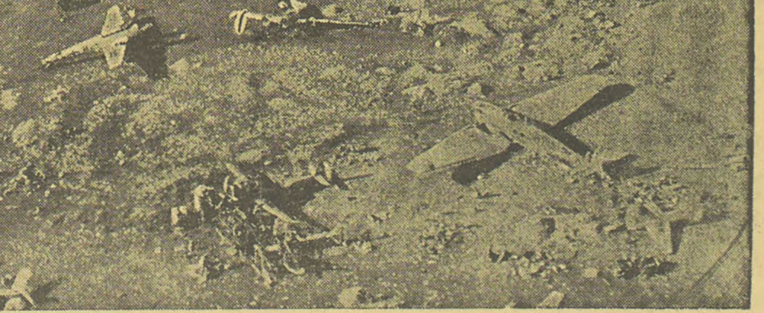
Sur l'aérodrome de Derna, le terrain est jonché de carcasses d'avions ennemis.

Pendant la journée d'hier, les bombardiers de la R.A.F. et les escadrilles de la France libre, ont