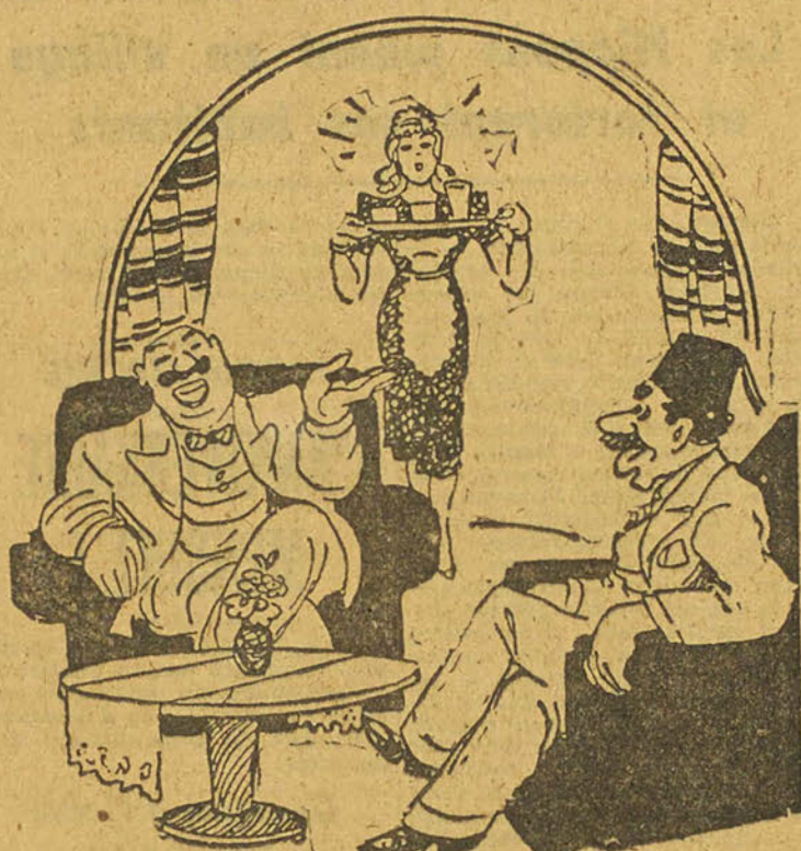
LES HOMMES NOUVEAUX — Vous comptez envoyer votre fils à l'université ? — Je compte plutôt l'installer boulangier. C'est le seul moyen d'assurer son gagne-pain. (AL CHO'OLA)

la Gestapo, ce journal et une demi douzaine d'autres «couvrent» toute la Belgique avec