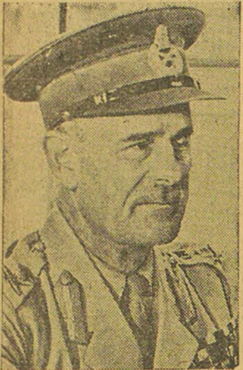
LE GENERAL WAVELL