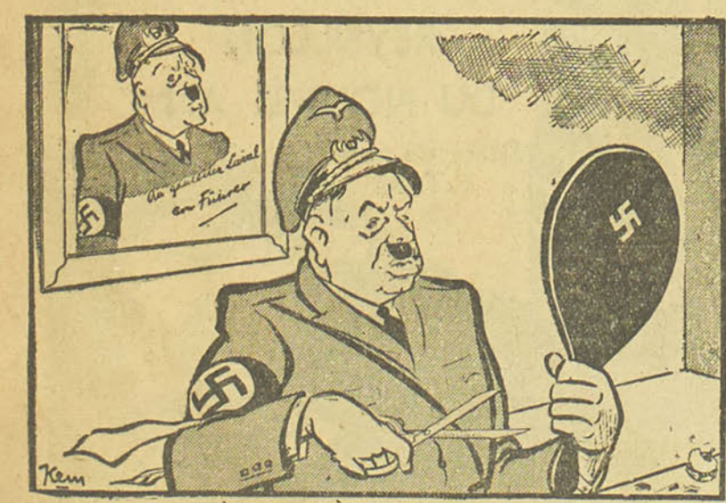
LA MANIÈRE DE...