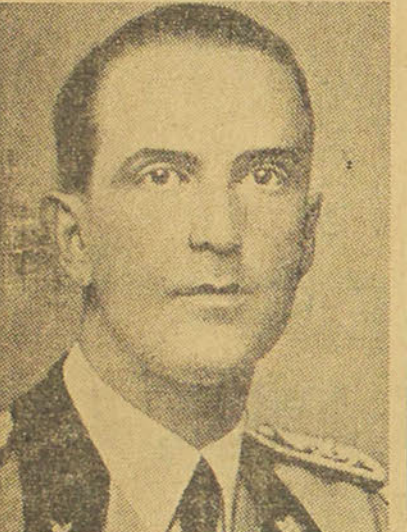
S.A.R. LE PRINCE UMBERTO de Savoie qui fut privé du titre de prince héritier par le Grand Conseil Fasciste

Le discours que M. Winston Churchill a fait hier à la nation italienne est franc, courageux et opportun. Il a exprimé avec son magnifique talent d'orateur et de penseur ce que nous éprouvons tous : une aversion profonde pour le fascisme, le vil regret de voir l'Italie engagée dans cette guerre aux côtés de l'Allemagne hitlérienne, et le désir sincère qu'elle reprenne bientôt le cours normal de son destin. Le Premier ministre de Grande-Bretagne n'a pas tenu aux Italiens le