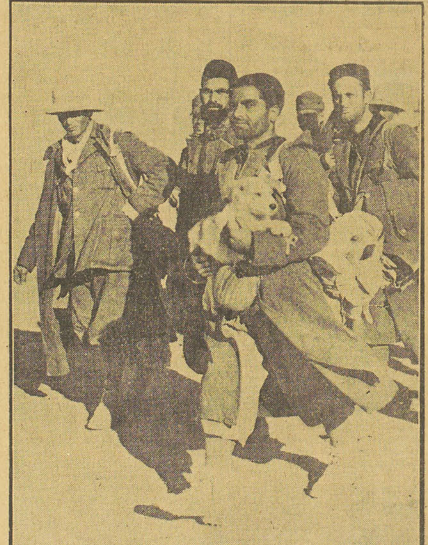
Un groupe de prisonniers italiens se dirigeant vers un camp.

Le Caire, 23 (N.E.B.). — Le nombre des prisonniers italiens pris dans le désert occidental augmente graduellement et s'approche des 40.000. Plus de 35.000 ont déjà été évacués de la zone de la grande bataille livrée à Sidi-Barrani et plusieurs milliers seront encore ramené des régions que les forces britanniques ont « nettoyées » au cours de leur avance de Sidi-Barrani.