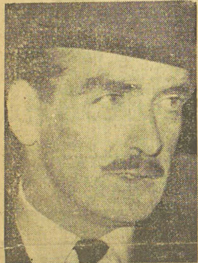
M. ANTHONY EDEN

Lorsque, le 21 février 1938, M. Anthony Eden, sacrifié à la politique d'apaisement de M. Neville Chamberlain à l'égard des dictatures, dut