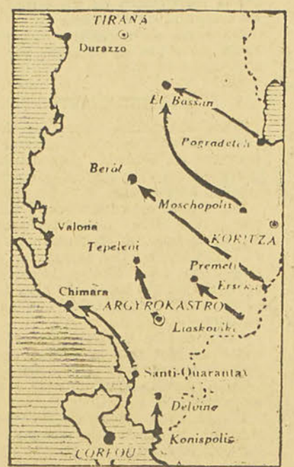
Carte de la côte albanaise indiquant la position de Chimarra

que les appareils attaquaient en piqué et les prirent sous le feu croisé de leurs armes.