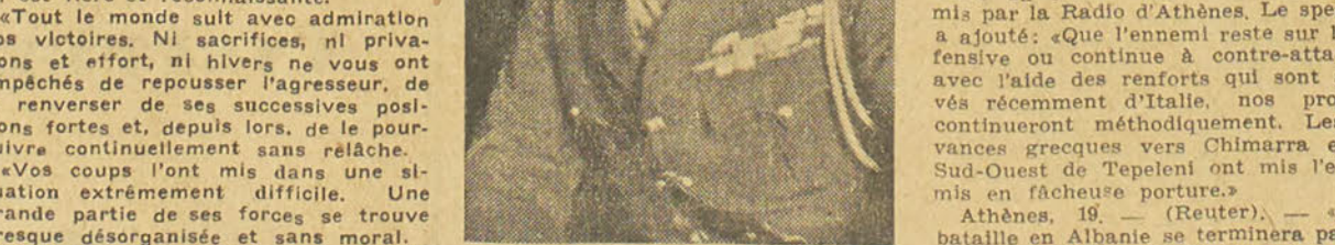
LE GENERAL PAPAGOS commandement grec, qui ajoute: «L'ennemi a été délogé de ses positions à la pointe de la baïonnette nonobstant une vigoureuse résistance. Il a laissé sur le terrain de nombreuses armes automatiques et autres armes. Aujourd'hui l'aviation ennemie a éprouvé des attaques sur des hôpitaux, malgré les insignes visibles de la Croix Rouge. Nos avions ont bombardé avec succès des objectifs militaires.

Athènes, 19 (Agence d'Athènes). — Le général Papagos, commandant en chef des armées helléniques, a adressé aux troupes l'ordre du jour suivant : «Par moi, premier ordre, lors du commencement de la guerre, je vous invitais à combattre avec acharnement et un indomptable courage. Vous le fîtes sur toute la ligne et la Grèce entière est en fier et reconnaissant. «Tout le monde suit avec admiration vos victoires. Ni sacrifices, ni privations et effort, ni hivers ni vous ont empêchés de repousser l'agresseur, de le renverser de ses successives positions fortes et, depuis lors, de le poursuivre continuellement sans relâche. «Vos coups l'ont mis dans une situation extrêmement difficile. Une grande partie de ses forces se trouve presque désorganisée et sans moral. «Officiers, sous-officiers et soldats du front albanais, notre annemi chancelle. Il chancelle sur le front devant nous et, en Afrique, devant les Anglais; il chancelle même à l'intérieur de son propre pays. L'hiver hâtera son anéantissement. Persistez pour que nous le brisions définitivement et le jetons à la mer. La victoire sera nôtre et sera la plus belle victoire de notre histoire. En avant. La victoire sera vôtre.