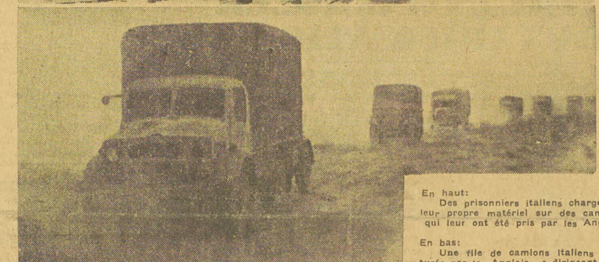
En haut : Des prisonniers italiens chargent leur propre matériel sur des camions qui leur ont été pris par les Anglais. En bas : Une file de camions italiens capturés par les Anglais, se dirigeant vers un camp britannique.