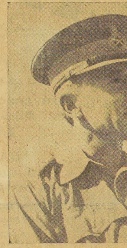
LE GENERAL O'CONNOR

Le seul inconvénient était que la visibilité ne dépassait pas deux cents mètres.