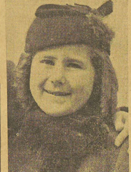
La Famille Royale fête aujourd'hui l'anniversaire de S.A.R. la Princesse Fathia, la plus jeune des sœurs de S.M. le Roi.

S.A.R. LA PRINCESSE FATHIA FETE AUJOURD'HUI SES DIX ANS