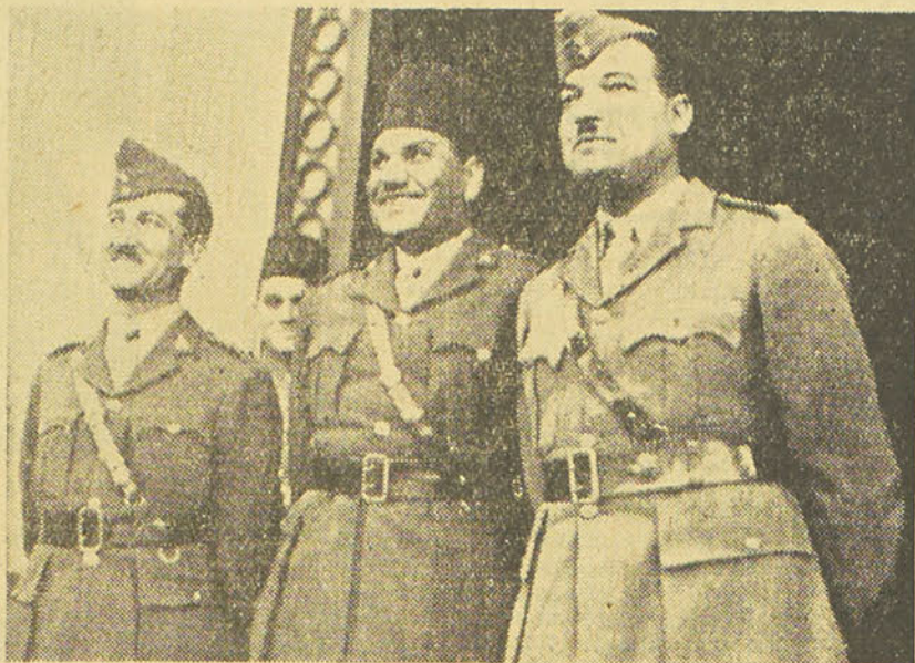
Nous avons annoncé hier que trois officiers ayant rang de sagh (commandant) avaient été classés premiers dans un concours dont le sujet était constitué par une étude sur la politique militaire que doit suivre l'Egypte en tenant compte de sa position géographique, de sa population, de sa superficie et de sa richesse.

LES LAUREATS DU PRIX FAROUK 1er. VENANT DU DESERT DE L'OUEST