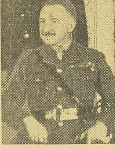
Le général SIR J. MARSHALL-CORNWALL

Il est nommé chef d'état major du général Sir Archibald Wavell Le Lieutenant-général Sir J. Marshall-Cornwall, qui fut le premier chef de la mission militaire britannique en Egypte, vient d'être désigné pour assister