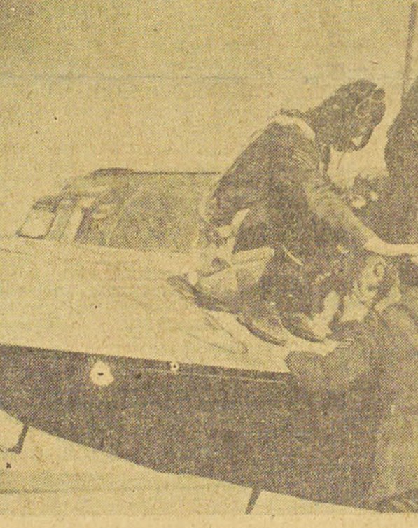
Le fétiche de l'escadrille, c'est le orâne dénudé de ce sergent que ses camarades viennent consciencieusement toucher avant de prendre leur vol. Il paraît que c'est infallible, mieux qu'un patte de lapin.

SUR 2000 commandes passées à la Grande-Bretagne 1999 sont normalement livrées