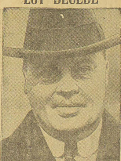
Londres, 26. — (Reuter). — On annonce la mort, aux Berrades, de lord Rothermere, propriétaire du «Daily Mail». Il avait été ministre de l'Air en 1917/18.