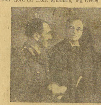
S.M. le Roi Georges II de Grèce président un conseil récemment tenu en Grèce.

Succès grecs Londres, 26 (Reuter). — De source autorisée, on apprend que dans le secteur nord du front albanais, les Grecs