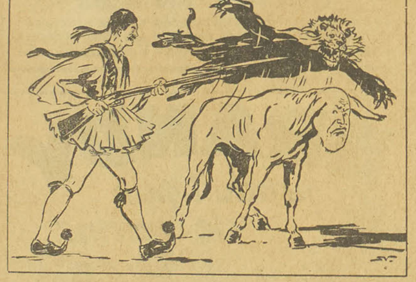
(Dessin de Stamati Vassiliou)