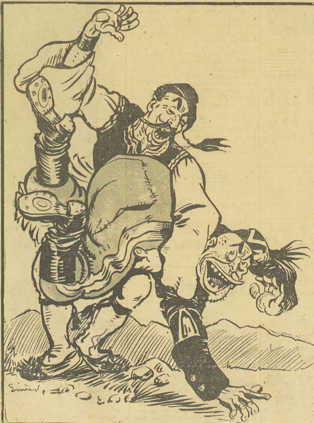
Dessin de Juan Sintès