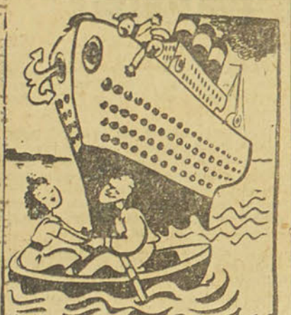
Rien ne nous séparera jamais, ma chérie.