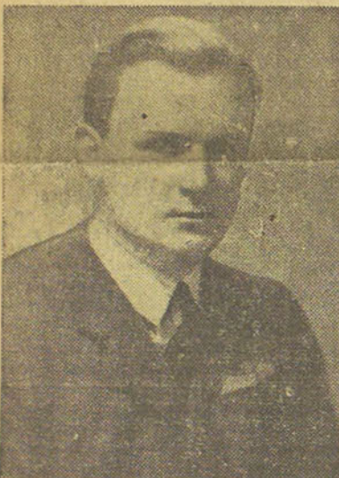
Flying Officer ANTHONY G. WORCESTER héros de l'air, mort dans l'accomplissement de son devoir au désert de l'ouest.

Quoi qu'il en soit, le IIIe Reich entra en guerre avec d'énormes avantages dans le domaine des forces aé-