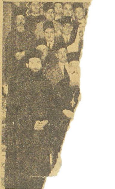
A l'issue du triarque Cy Georges H.

Hier, Son Altesse a reçu le bassaden de Grande-Bretagne qui a fait ses adieux.