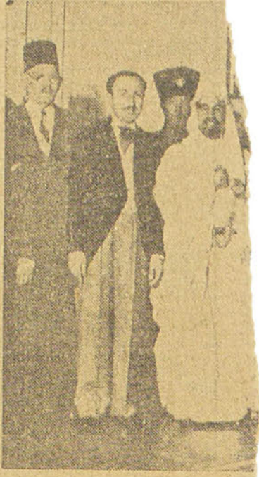
S.A. l'Emir Abdalla et S.A.R. le légation de Turquie au cours du t

S.A. l'Emir Abdalla est arrivé en terme de sa visite en Egypte. L'Emir de Transjordanie part ce à 5 heures 30 dans un wagon spécial à destination de Palestine en route pour Amman. Il sera accompagné de sa suite de la princesse, épouse de l'Emir Navef.