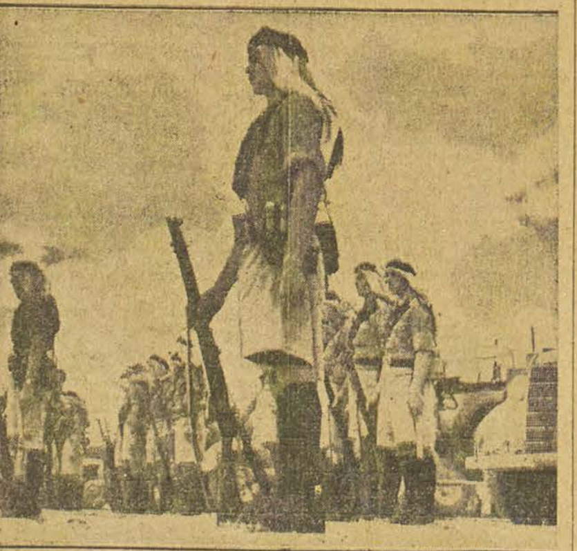
Une unité des forces qui défendent le désert de Transjordanie.