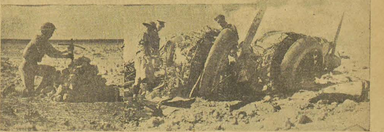
Après la bataille aérienne de Marsa Matrouh : On voit ci-dessus l'unique survivant italien du combat parlant à un pilote de la R.A.F. et, en dessous, les débris d'un « Savoia » de bombardement, ainsi que les occupants.