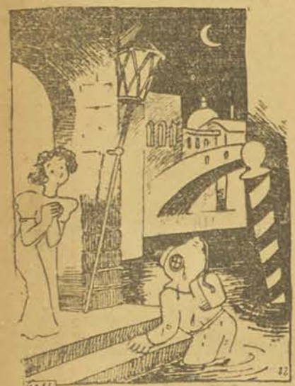
A Venise. — Il n'y avait pas de gondole libre, alors j'ai fait le chemin à pied!

Et bien, s'ils sont carrés, c'est conformément à la loi... ou plutôt à une ordonnance de Louis XVI, du 2 janvier 1788, et qui dit textuellement ceci : "La longueur des mouchoirs qui se fabriquent dans le royaume sera égale à leur largeur."