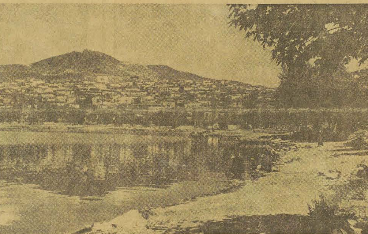
Panorama de Castoria et du lac

Le dernier coup porté aux espoirs italiens d'effectuer une rapide avance en Grèce réside dans la prise par les Grecs du village de Zemjal Waere sur le lac d'Ohrid. De nombreux soldats italiens, qui ont été faits prisonniers, se plaignent « d'avoir été trahis par les Albanais. »