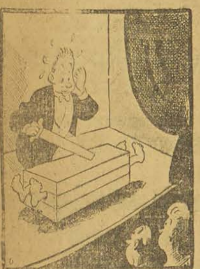
— Diable! Il s'est placé encore une fois de travers, dans la caisse!