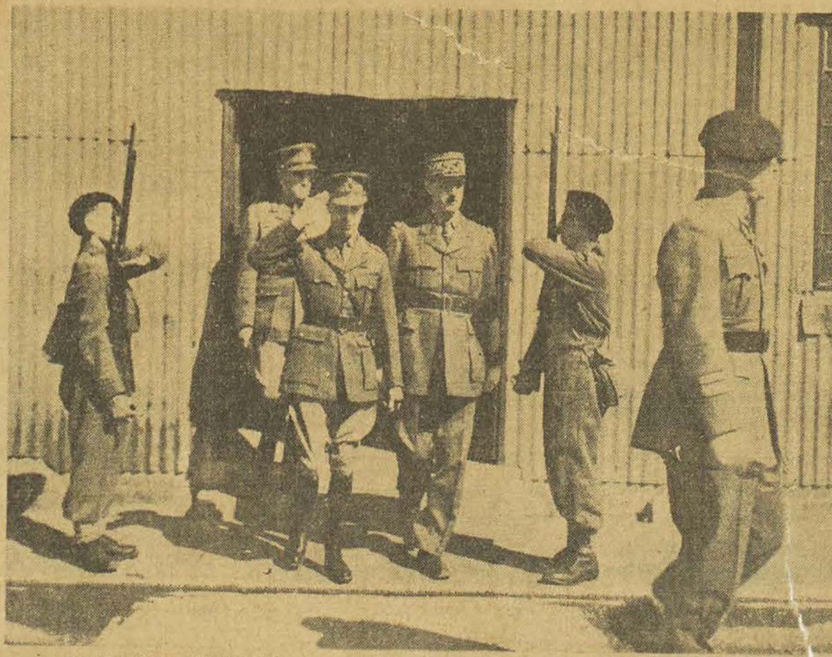
Le Roi George VI visitant les troupes françaises libérées en compagnie du général de Gaulle.

Washington, 30 (Reuter). — Le Colonel Knox, secrétaire à la Marine, a déclaré aujourd'hui qu'il indiquait la destination de cinq destroyers américains, dix-sept bombardiers et un navire affecté au service des hydravions, qui ont quitté Key West avec des ordres cachetés. On laisse entendre que les vaisseaux vont peut-être se rendre à la Martinique Française, où les divergences d'opinion entre les partisans et les adversaires du gouvernement de Vichy ont presque, assure-t-on, atteint leur point culminant.