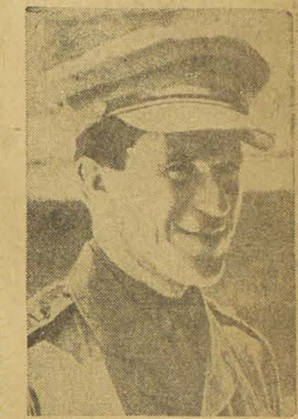
Le Colonel LAWRENCE dans l'uniforme de l'armée britannique qu'il portait vers la fin de ses jours

Cette indépendance politique future doit bénéficier tous les peuples arabes ne peut toutefois se concevoir que dans le cadre d'une solidarité humaine organisée qui, espérons-le, remplacera pour le mieux le système caduc de la Société des nations. Les peuples arabes comme les peuples européens devront donc développer une de leurs vertus principales, tant soit peu oubliée par des nationalismes importés ou artificiels : le sens de la fraternité des peuples qui est à la base du monothéisme. Cette grande vertu politique, le fascisme et le nazisme la combattent farouchement.