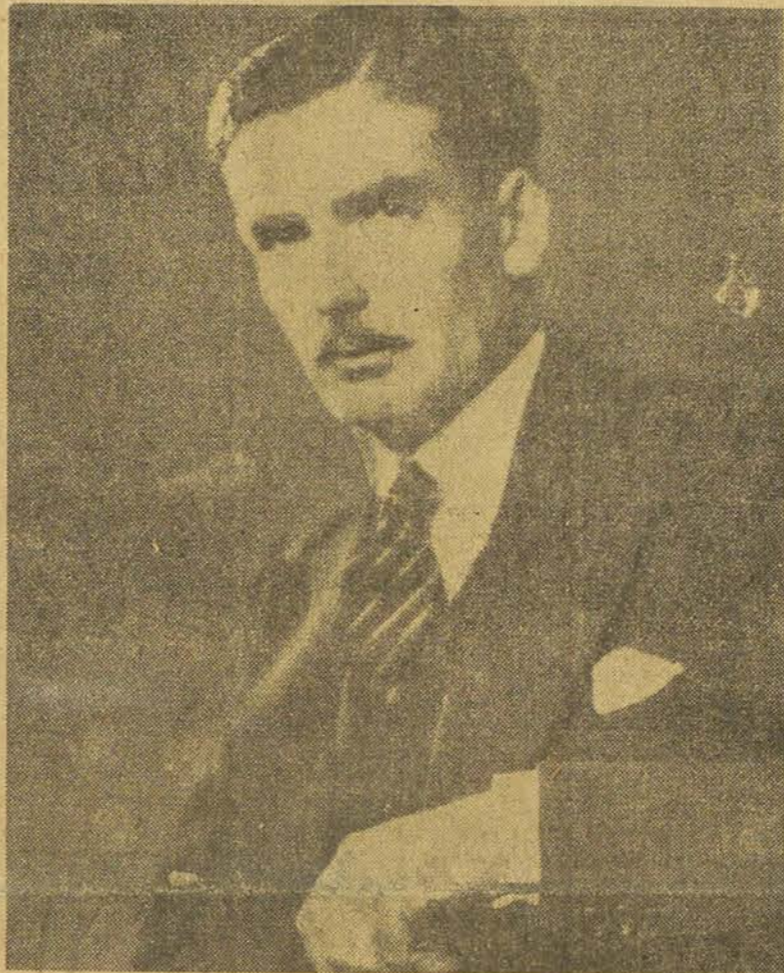
M. ANTHONY EDEN

M. Eden visitera également des contingents des forces anglaises et alliées dans le Moyen-Orient.