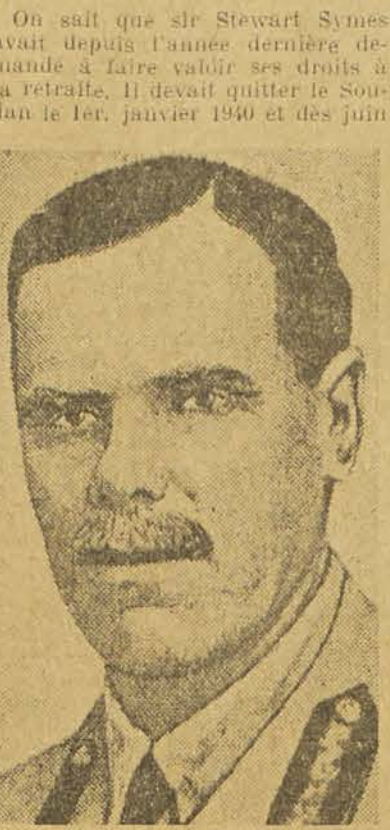
Le général H.G. HUDDLESTON pacha 1939 son successeur avait été nommé par décret royal.

Le général Huddleston pacha n'est pas un nouveau venu au Soudan, il commanda les forces soudanaises pendant plusieurs années et assumait le poste de gouverneur général p.i. à plus d'une reprise.