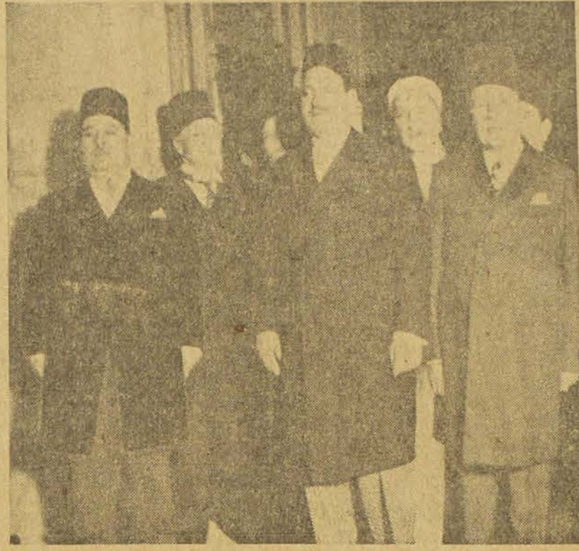
Voici quelques-unes des personnalités qui eurent l'honneur d'être invitées au palais d'Abdine, hier soir, à l'heure de l'iftar.