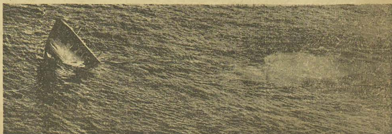
Le sous-marin a définitivement coulé.