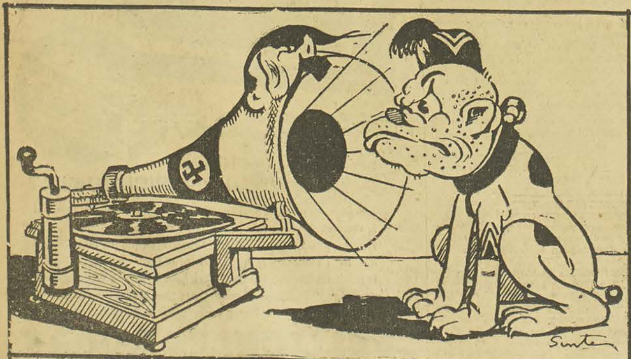
His Master's Voice

Dessin de Juan Sintès, (Exclusivité «Bourse Egyptienne»).