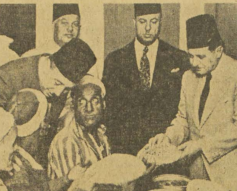
S.E. Mohamed el Sayed Chahine bey, gouverneur du Caire, distribuant du pain aux pauvres du Caire.

Tous les indigents du pays étaient hier à l'heure de l'iftar, les hôtes de S.M. le Roi.