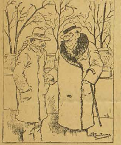
PHILOSOPHIE SEREINE Mon cher, ça ne peut pas aller plus mal, donc ça va aller mieux.

LA FUMISTERIE A TRAVERS LES AGES Le village de Caerleon, dans le pays de Galles, qui fut l'Isca Silurum des Romains et la capitale de la «Britannia secundaria», possède, entre autres ruines, celles d'un ardoisier assez bien conservé.