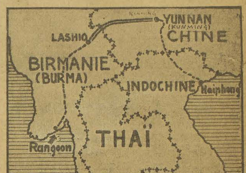
Notre carte montre : 1) Le tracé de la route de Birmanie, de Lashio à Kunning (Yunnan). Il est intéressant de savoir que Lashio est relié par la voie ferrée Haiphong-Kunning, à travers l'Indochine française, que le gouvernement de Vichy a définitivement fermée à Chang Kai Tchék.