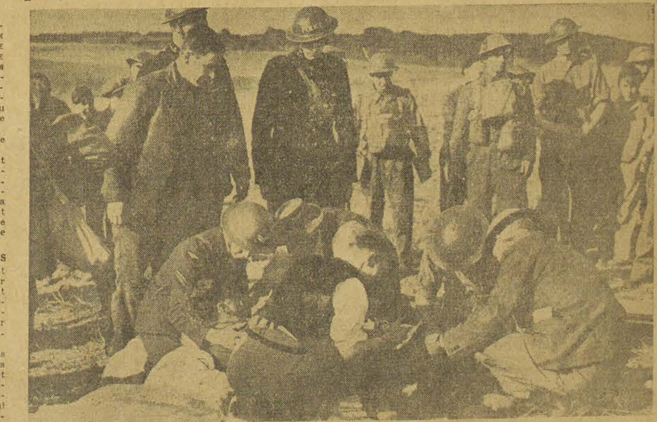
Un pilote allemand vient de tomber avec son avion dans la banlieue de Londres, immédiatement la police est sur les lieux et aussi les ambulanciers, car l'Allemand est blessé.