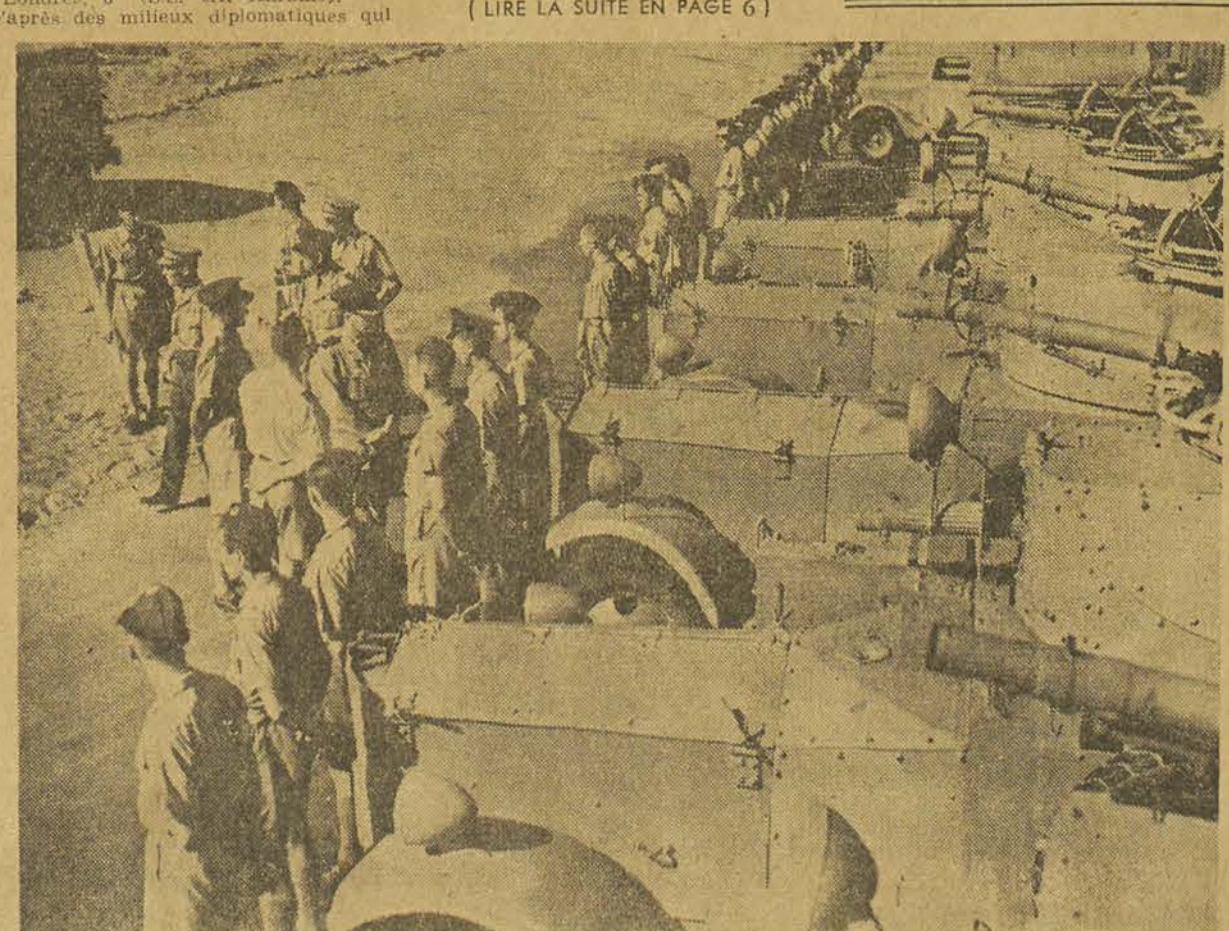
L'Air Chief Marshal Sir Arthur Longmore a visité récemment quelque part au désert de l'Ouest les unités d'autos blindées qui dépendent de la R.A.F.

Des avions japonais à Hanoi Tokio, 7. (Reuter). — D'après une dépêche de Canton, le quartier général de l'armée japonaise dans la Chine du sud annonce que trois formations d'avions militaires japonais ont atterri samedi dans l'aéroport de Hanoi, conformément à l'accord conclu entre le Japon et l'Indochine.