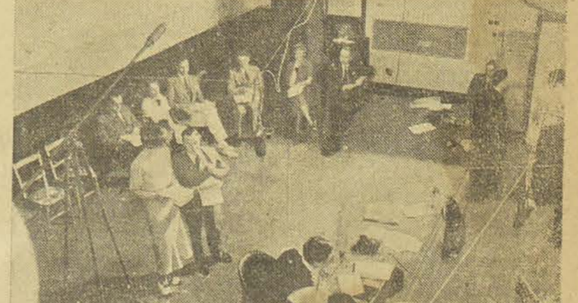
Un téléphone par terre, un gong, des rôles éparpillés, des signaux lumineux, des câbles électriques; envers du décor... Combien d'entre nous savent ce qui se passe derrière leur poste de radio ? Voilà de quel est fait le plaisir des auditeurs... (Photo BOURSE).

— La prochaine fois nous n'annoncerons pas la date ! Dessin de Juan Sintès, (Exclusivité «Bourse Egyptienne»).