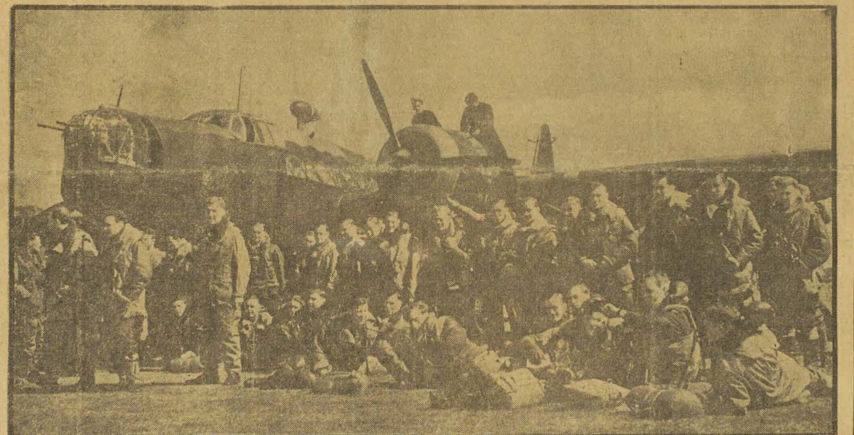
Goering prétendait que les défenses contre avions de Berlin étaient telles qu'aucun appareil ennemi ne pourrait jamais s'approcher de la capitale allemande. Voici quelques-uns des aviateurs britanniques qui infligèrent un cinquantième démenti au maréchal en bombardant plusieurs nuits de suite, les usines de Berlin et des environs.

D'autres avions encore bombardèrent les mines d'amiante Krupp à Essen où de violentes explosions retentirent. Non moins de treize aérodromes furent bombardés au cours des opérations de cette nuit.