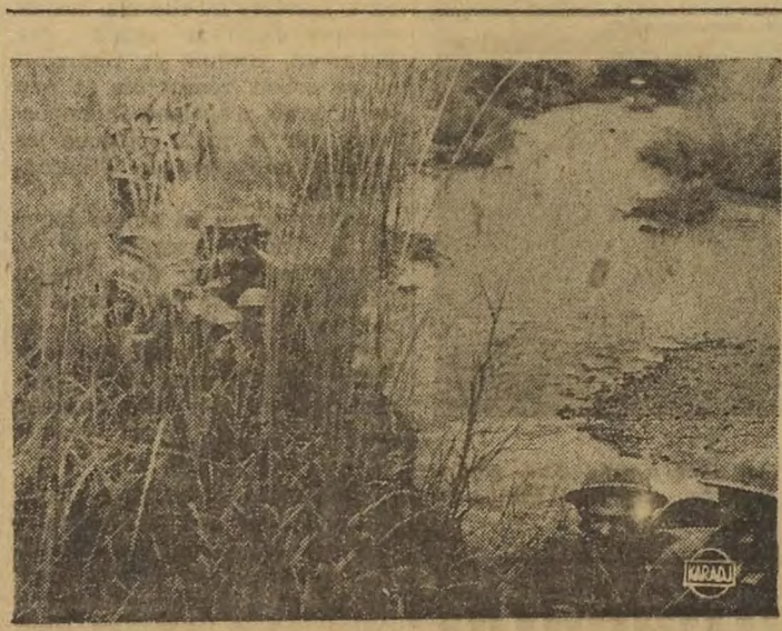
On ne parle pas assez des braves qui combattent en Birmanie dans des conditions très difficiles. Cette photo nous en donne une idée. La 14e armée britannique fait du bon travail. Voici quelques uns de ses soldats, s'ouvrant un chemin dans la jungle, en direction de Mohngin.

« Monsieur le maire de la commune prétend que vous avez mal interprété l'inscription et qu'il faut lire: «RESERVOIR». ANECDOTES TURQUES Un titre pieux, chaque fois qu'il avait envie de manger une friandise, en demandait le prix au vendeur. Il mettait l'argent dans une bourse spéciale et s'éloignait sans rien acheter en disant: «Supposons que j'en ai mangés». La somme économisée par ses privations volontaires lui permit de faire construire dans un âge avancé une jolie mosquée à Stamboul. On l'appela la «Mosquée Supposons-que-j'en-ai-mangés». TISSUS EN PEAU DE SOURIS Des techniciens du textile japonais ont récemment découvert un procédé qui permet de transformer en tissu la peau des souris et des rats. C'est là une découverte fort originale et qui a déjà été mise en pratique: le tissu obtenu au moyen de cette peau peut parfaitement servir à la confection des vêtements. Tous les Japonais ont été invités à participer à la chasse aux souris et aux rats. Dans ce but, le gouvernement paie, pour chacune des peaux de ces rongeurs, une somme d'argent, naturellement minime. En outre, on a expliqué à la population la façon dont les peaux doivent être traitées pour se transformer en étoffe.