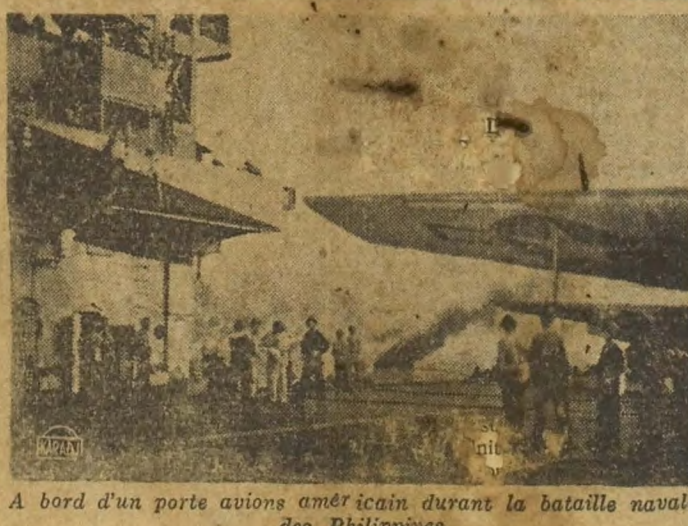
A bord d'un porte avions américain durant la bataille navale des Philippines.

Paris, 4. (AFP). — Des mesures sont prises par le ministre des communications en rapport avec les autorités britanniques, en vue de la reprise du service de passagers par chemins de fer et par bateau entre Londres et Paris pour le courant du mois de janvier. Les passagers civils seront admis en nombre limité. Ceux-ci devront être munis d'un ordre de mission délivré dans le cas où leur voyage est effectué dans l'intérêt de la nation. Le visa de sortie français et le visa d'entrée britannique seront nécessaires. Il est recommandé d'avancer au voyageur des conditions de leur hébergement en Angleterre. On devra également tenir compte des restrictions sur l'exportation des devises étrangères. Les demandes de transport de fonds devront être effectuées par l'intermédiaire du contrôle des changes.