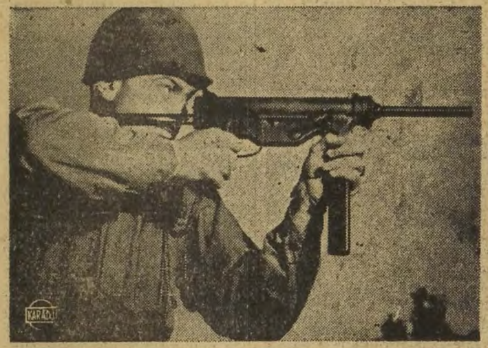
Les soldats américains aéroportés, sont armés d'un canon miniature pilotant. D'un calibre de 45 m/m, il pèse 4 kilogrammes et tire 450 coups à la minute.

Le fait que les Démocrates sont aux commandes ne signifie aucunement que le Président puisse compter sur une allégeance aux critiques portées contre sa politique. L'éditorialiste poursuit ainsi: «La difficulté majeure consiste en ce fait déplorable que dans la sphère politique, l'Amérique et la Grande-Bretagne ne travaillent pas harmonieusement ensemble. Elles tendent à poursuivre des politiques divergentes dans nombre de domaines différents... Tout cela est décourageant pour nous.»