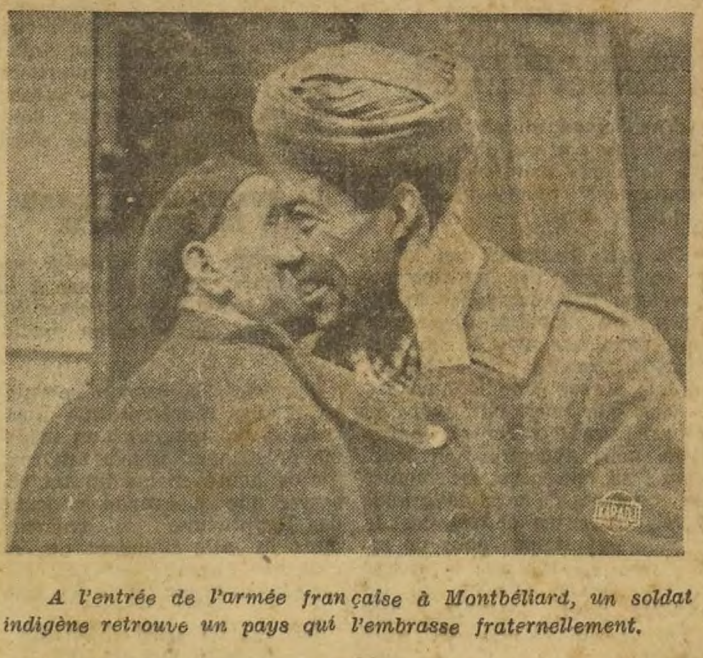
A l'entrée de l'armée française à Montbellard, un soldat indigène retrouve un pays qui l'embrasse fraternellement.