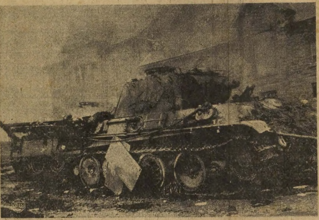
Tanks allemands mis hors de combat au cours de la bataille des Ardennes. Cette photo a été prise dans un village belge après sa réoccupation par les Américains.

Paris, 5 (AFP). — Le Col. de Marnier, vient d'être porté disparu à la suite d'une mission de liaison aérienne entre l'Afrique du Nord et le métropole.