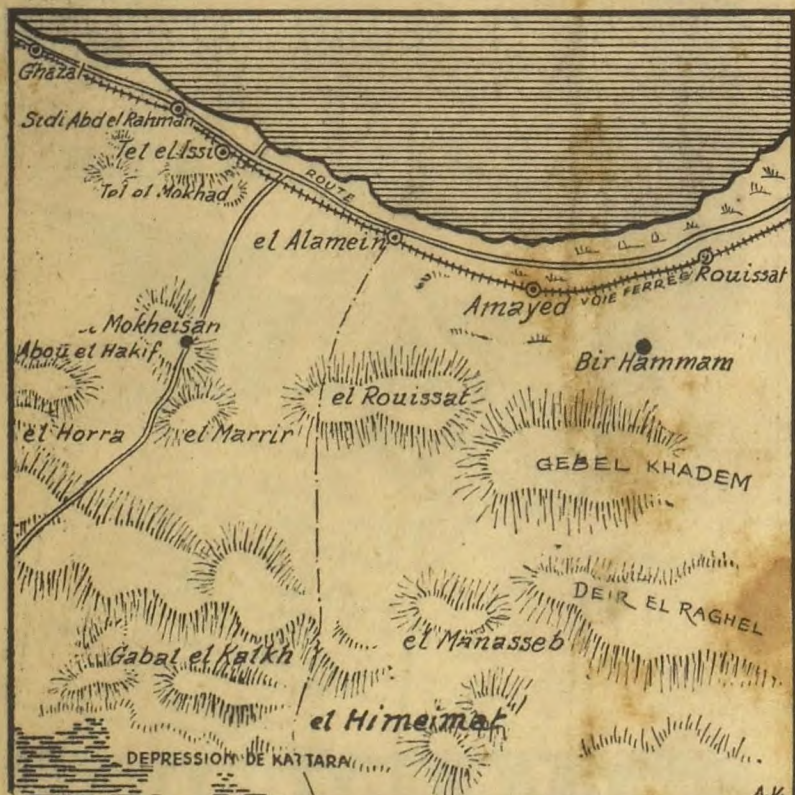
C'est dans le secteur méridional du front d'El-Alamein que Rommel lança son attaque lundi matin, en direction d'El-Himeimat, une localité située en bordure de la dépression de Kattarah. C'est là que se déroulent actuellement les combats entre les deux adversaires.

Né à Vienne, il était venu d'Autriche aux Etats-Unis il y a deux ans. Il laisse une veuve, qui est membre d'une grande famille anglaise, et deux filles.