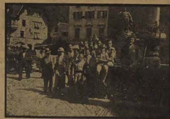
Au Pays de Tell...