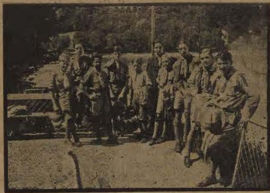
Gai ! gai ! faut passer l'eau...

Tantôt à pied, tantôt en train ou en autocar, ils déroulèrent à travers notre pays les méandres capricieux d'un merveilleux itinéraire.