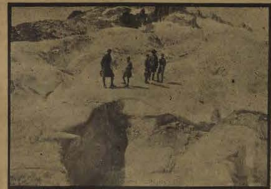
Salut ! glaciers sublimes...