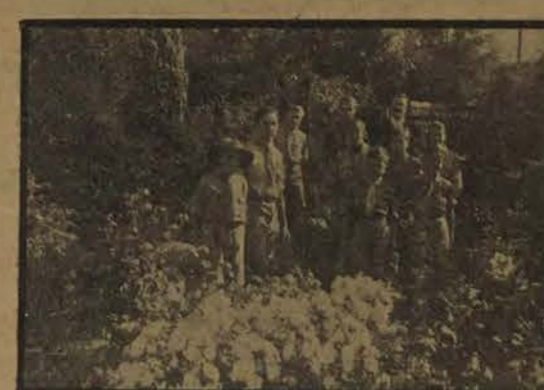
Une halte fleurie...