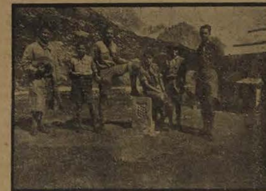
La séparation des Races...