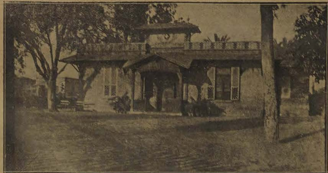
LE CERCLE SUISSE DU CAIRE

Car, à côté de cette paisible vie campagnarde se dressent les arêtes des rochers, se mêlent de sombres couleurs à l'horizon et, cette vie familiale si reposante, se mêle sans terreur aux vaines menaces d'une nature violente... Oleg. LEWITZKY.