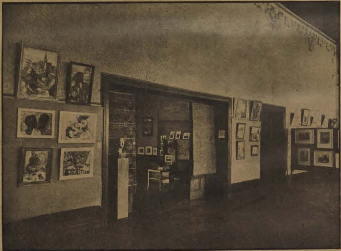
La Quinzaine suisse : Une des salles de l'Exposition.

Il fallut redonner cette fantaisie de bonne humeur et de gaieté, dans la Grande Salle, en guise de hors-d'œuvre et le public renouvela à l'auteur et à ses interprètes les témoignages du plaisir qu'ils prirent à les écouter.