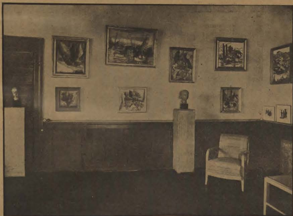
La Quinzaine suisse : Une vue de l'Exposition.

La Section Photographie contient des photos documentaires du Dr. Maurer, d'une valeur artistique indéfinissable, et qui témoignent d'une grande patience et d'un merveilleux don de photographe. J'apprécie peu les photos de M. P. Racine, les trou-