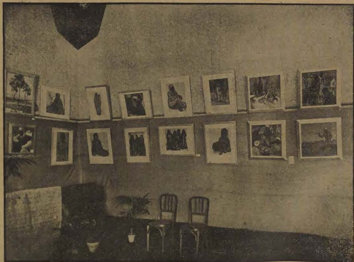
La Quinzaine suisse : Un coin de l'Exposition.

Reconnaissons franchement, sans brûler ce que nous adorons, que, à l'audition de la «Pastorale d'été» et du «Roi David», nous avons été agréablement impression-