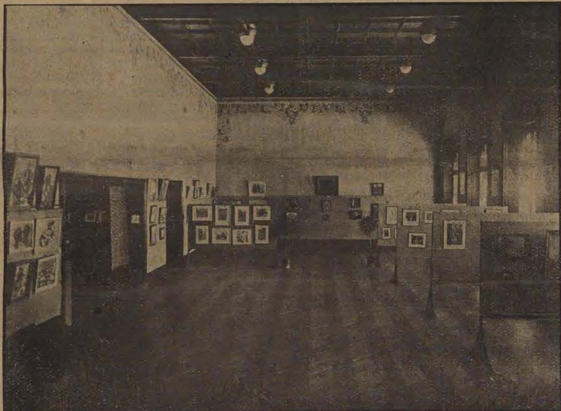
La Quinzaine suisse : La Grande Salle de l'Exposition.