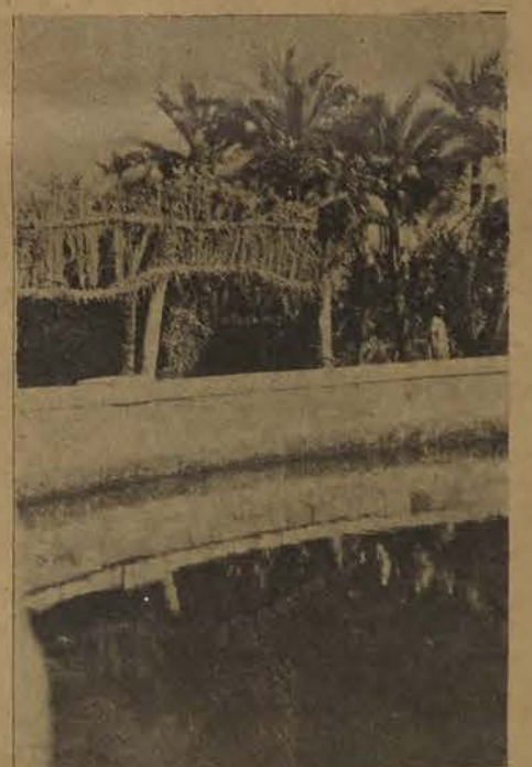
La Source du Soleil.