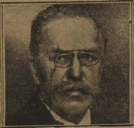
M. Schulthess, Président de la Confédération Suisse

Partout dans le monde, en Suisse également, la situation économique est grave, la situation politique ne l'est pas moins en maints pays. Tout semble chançalant et ébranlé. Favorisée par les progrès de la science et de la technique, la prospérité, obtenue avec l'appauvrissement des peuples, conséquence de la guerre, a créé un état de chose qui eût paru inimaginable, il y a peu de temps encore. Telle est aujourd'hui la situation, quinze ans après la guerre, à l'issue d'une période durant laquelle des efforts désespérés ont été accomplis sur le plan international pour faciliter et régler les relations économiques et pour établir un régime monétaire et commercial normal.