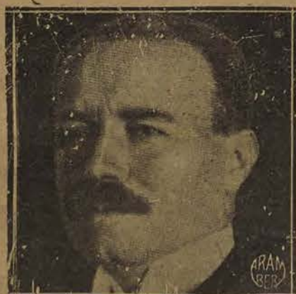
M. Musy, Conseiller fédéral

Au surplus, on doit procéder à des réductions dans tous les domaines où cela est possible. Un frein doit être mis aux générosités dues à la politique. Les subventions de l'Etat devront être réduites partout où on le pourra.