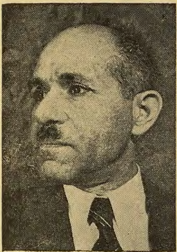
M. Abdel Moneim Moustapha Ministre d'Egypte en Suisse