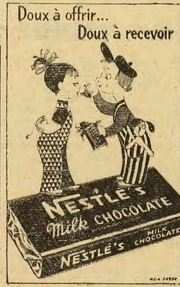
Doux à offrir... Doux à recevoir

Que peut-on conclure de tout ceci? On assiste, dans la pensée chrétienne à l'abandon des thèmes platoniciens et à la création d'une pensée originale.