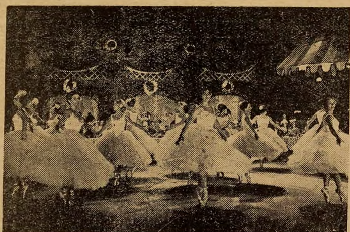
Une scène du film « Le Beau Danube Bleu. (la vie de J. Strauss) en couleurs.